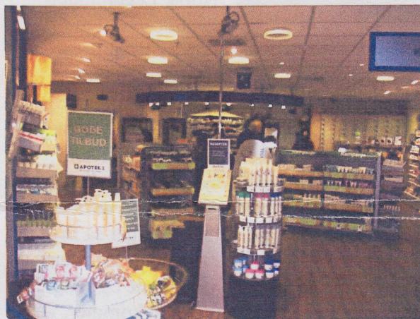
Den nye tid. Apotek på Brynsenteret, Oslo