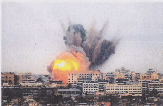
Bilde fra Gaza

beretning fra sitt internasjonale arbeid. Han har gjort tjeneste på to helt forskjellige steder, og under helt forskjellige omstendigheter. Dette gjør hans fortelling og refleksjoner særlig verdifulle for oss.