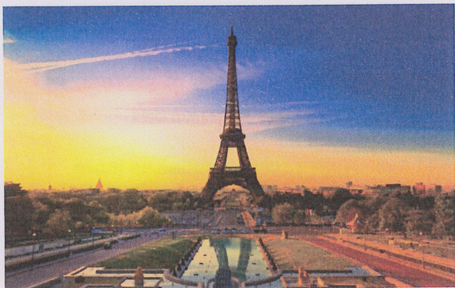
Eiffeltårnet i kveldssol

Den 41. internasjonale kongress for farmasihistorie finner sted i Paris 10. til 14. september i år. Kongresstedet er det medisinske fakultet ved Sorbonne, sentralt plassert på Seinens venstre side, i et distrikt med mange gode butikker og restauranter.