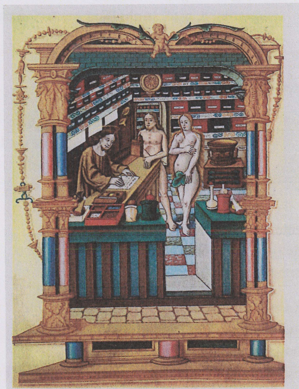
Kristus som apoteker ekspederer Adam og Eva

NFHS fikk overdratt alle midler fra det gamle Cygnus Forlag, med en avtale om at disse midler skal brukes til publisering av og ellers arbeid med farmasihistorisk artikkelstoff etter nærmere fastsatte regler. Disse midlene er satt inn på en egen konto, og presenteres som eget regnskap for 2012, under navnet Cygnuskonto.