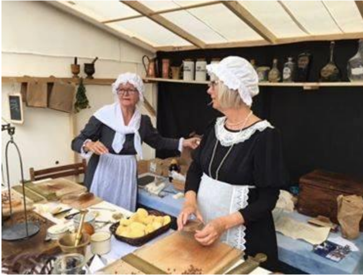
Pilletrilling - Pharmakon